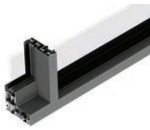
Ultraglide Max Light